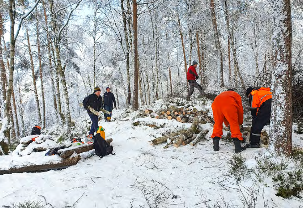
Dugnadsgjengen ved Myrdalsvann i aktivitet.