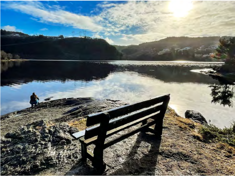
Stille dag ved Myrdalsvann.