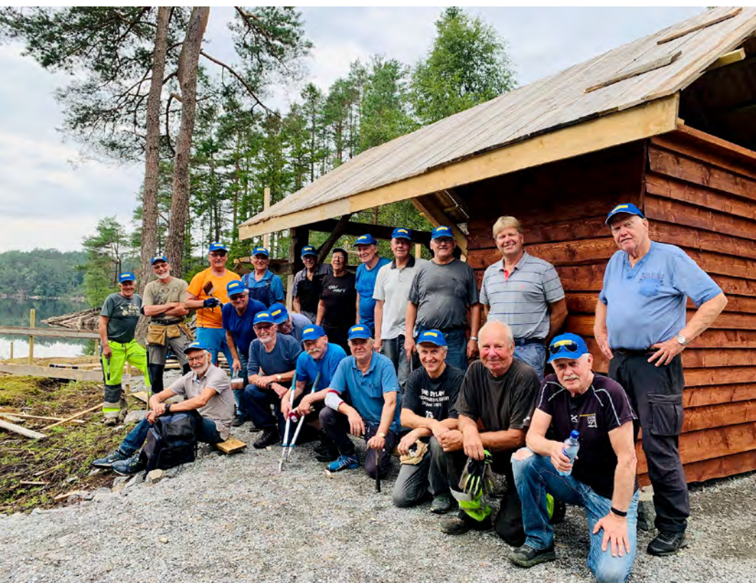
Dugnadsgjengen i Alvøskogen.