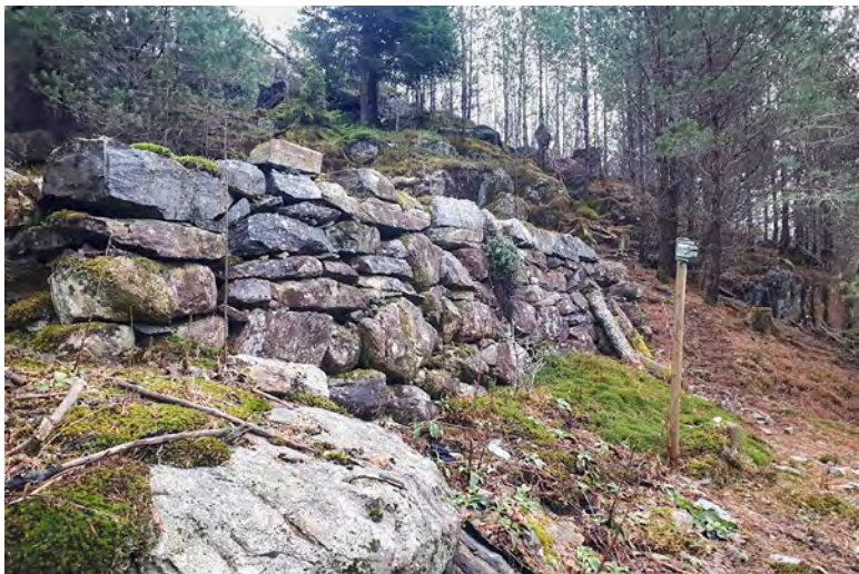
Gammel hustuff i Gullaksdalen.

Gamle veifar, murer, fangstanlegg m.m. er spor etter livet til mennesker og deres virke i det fysiske miljøet. Kulturminner kan også være steder knyttet til historiske hendelser, tro eller tradisjon. Før et arbeid settes i gang, bør det undersøkes om det er kulturminner i området.