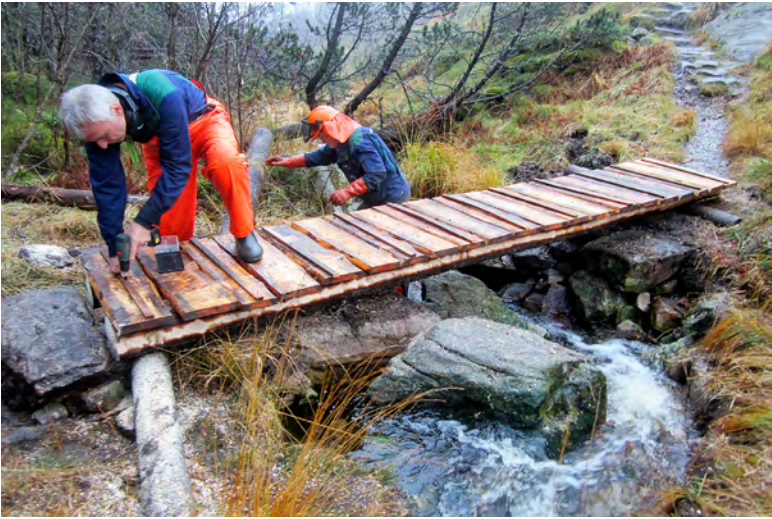
Dugnadsgjeng i arbeid med ny bro over Kvitursbekken.