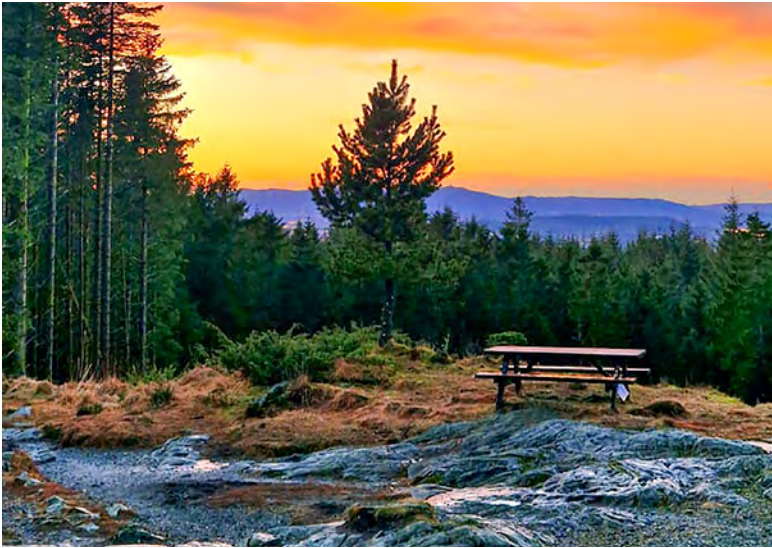
Kveld på Smøråsfjellet.