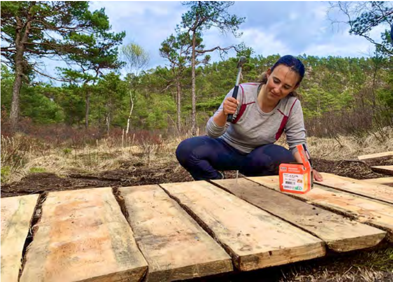
Snekring av klopp.