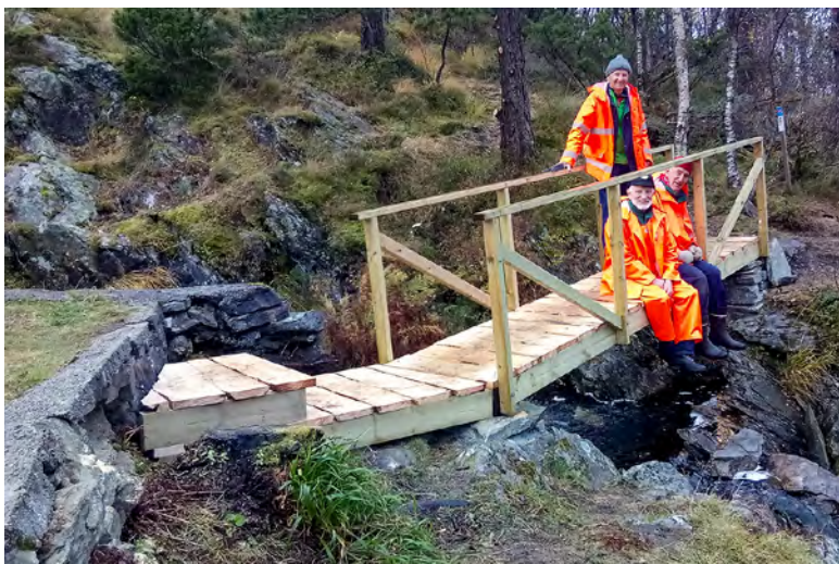
Broen ved Smådiket er ferdig.